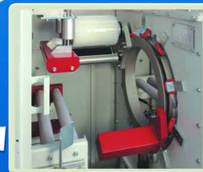
Anello di Rotazione Ring Wrapping Unit