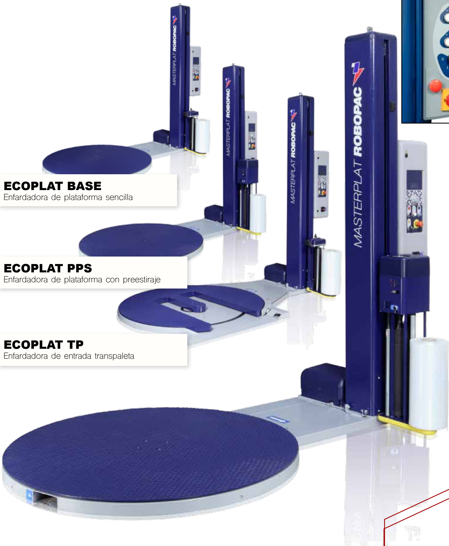
ECOPLAT TP Enfardadora de entrada transpaleta